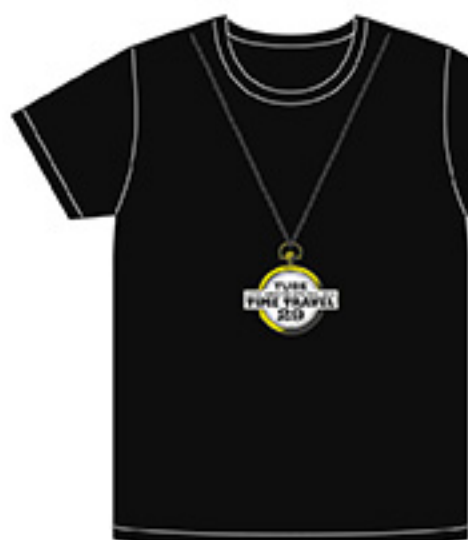
TシャツA (BK) ¥4,000 tax in