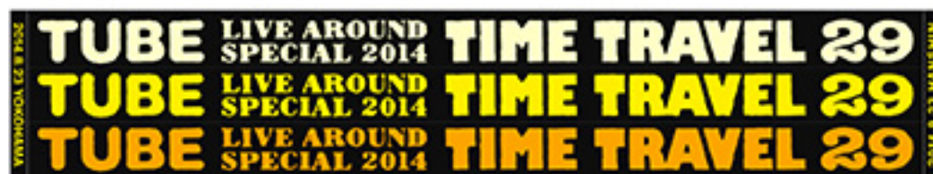
マフラータオル ¥2,500 tax in