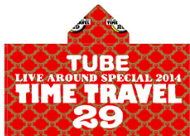
フード付きバスタオル ¥4,000 tax in