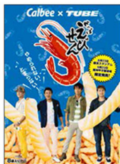
TUBEのかっぱえびせん ¥1,000 tax in