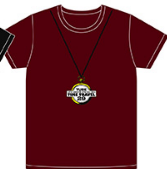
TシャツA (RED) ¥4,000 tax in