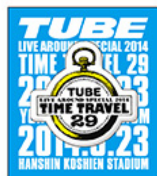
ピンバッジ ¥500 tax in