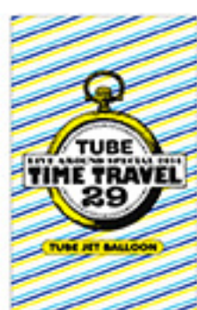
ジャット風船 ¥600 tax in