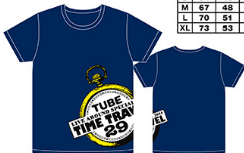
TシャツB ¥4,000 tax in