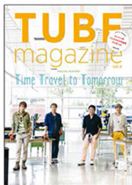
パンフレット (TUBE Magazine) ¥3,500 tax in