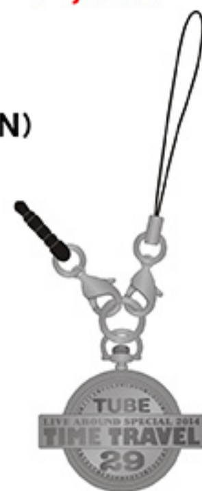
携帯チャーム ¥1,500 tax in